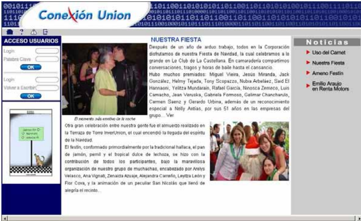
Fig 1. Home antes de autenticación de usuario