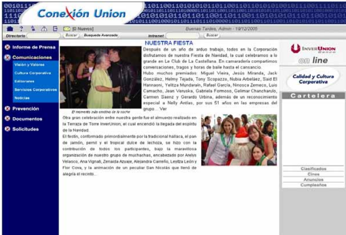
Fig 2. Home luego de autenticación de usuario