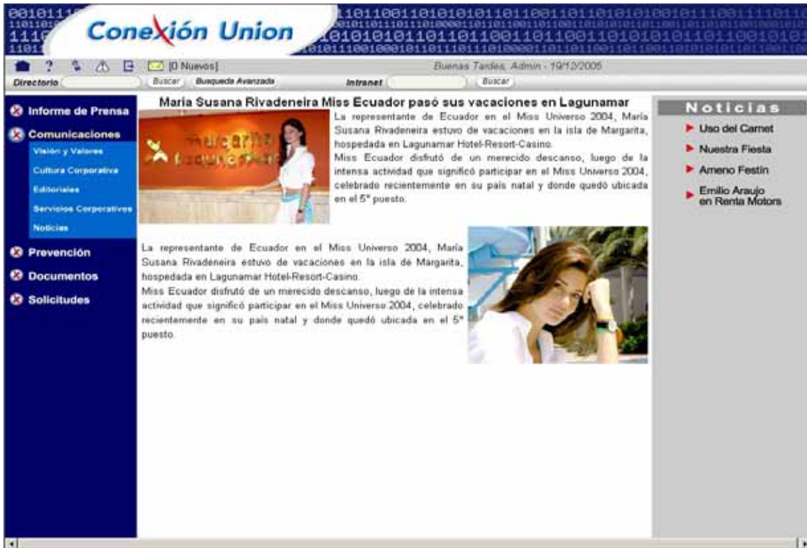
Fig 3. Apariencia de páginas de contenido